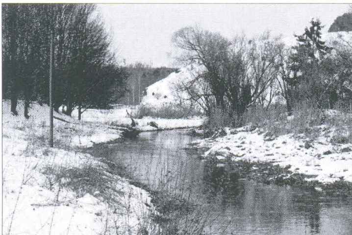
Im Frühjahr 2011 soll's losgehen unterhalb des Stettbergs mit der Umgestaltung eines Teilstücks der Hürbe zu einer kleinen Naherholungsanlage.

GIENGEN. Auf großes Interesse stieß das Angebot der Giengener Naturfreunde, die Firma Ziegler zu besuchen. H. Dorn informierte über Technik, Daten und die einzelnen Produktionsschritte. Ein zur Auslieferung nach Nigeria bereitstehender Wasserwerfer brachte alle zum Staunen.