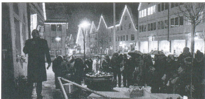
Auch wenn der Goldsternregen nur aus Pappe war: Gute Stimmung herrschte bei der Adventsfensteraktion vorm Rathaus.