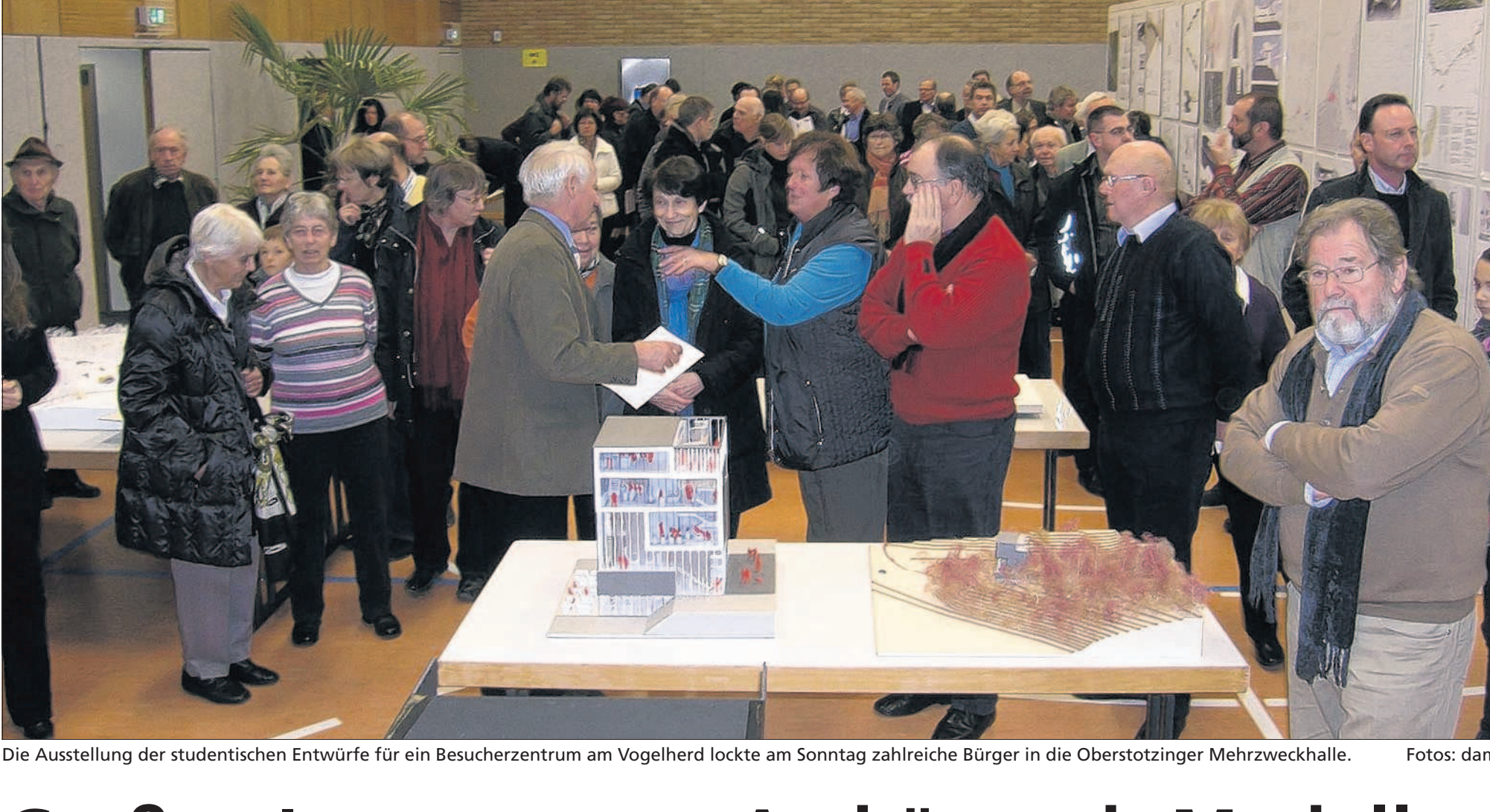
Die Ausstellung der studentischen Entwürfe für ein Besucherzentrum am Vogelherd lockte am Sonntag zahlreiche Bürger in die Oberstötzinger Mehrzweckhalle.