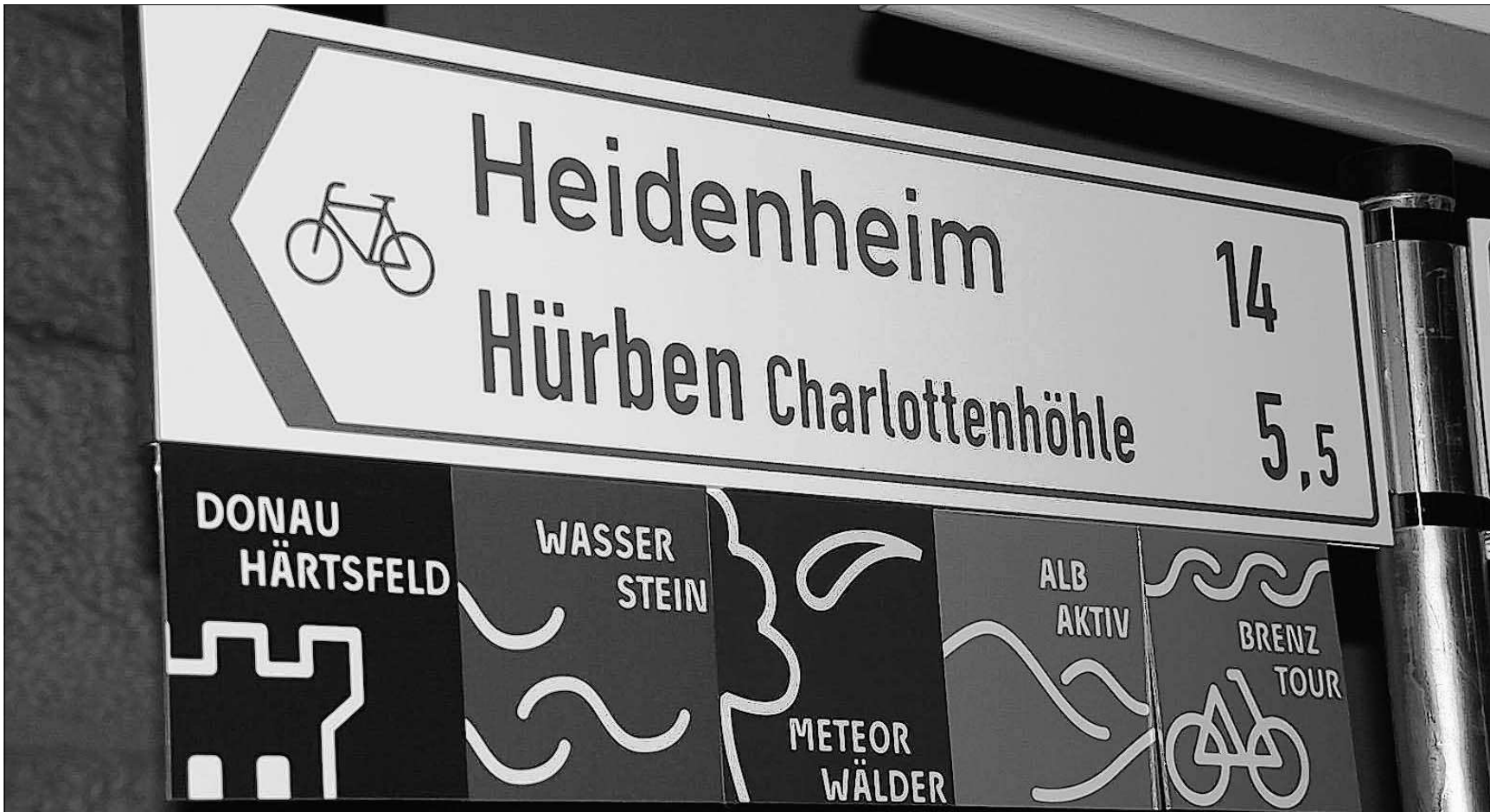
QUO VADIS, TOURISMUS: Wo im Fremdenverkehr im Kreis Heidenheim die Reise hinführt, erörtern verschiedene touristische Leistungsträger im Gespräch in der Königsbronner Hammerschmiede.

Karten sind bei der Stadtbücherei Langenau, Tel. 07345.962431 erhältlich.