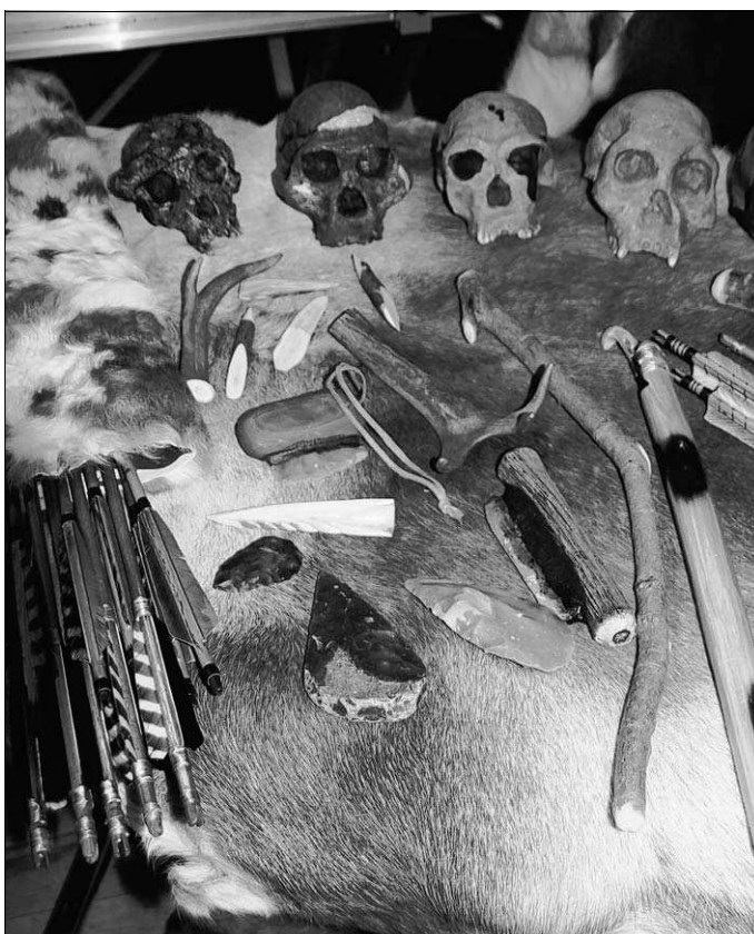
ALLES EISZEIT ODER WAS: Die regen Aktivitäten unserer Vorfäter stellen heute ein bedeutendes Alleinstellungsmerkmal für den gesamten Landkreis dar.

Ebenfalls hervorragend aufgestellt ist der Landkreis beim Thema Radfahren. Mit neuem Radwegkonzept, perfekter Infrastruktur und einer attraktiven Infoplattform wurden wichtige Grundlagen