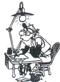
Von unserem Redaktionsgöschelde