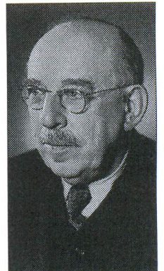
Hochgeschätzter Zeiss-Chef: Walther Bauersfeld (1879-1959)

Er war Zeiss-Chef, genialer Erfinder und ist Namenspate nicht nur einer Heidenheimer Straße, sondern sogar eines Asteroiden: Am Sonntag könnte Walther Bauersfeld seinen 132. Geburtstag feiern.