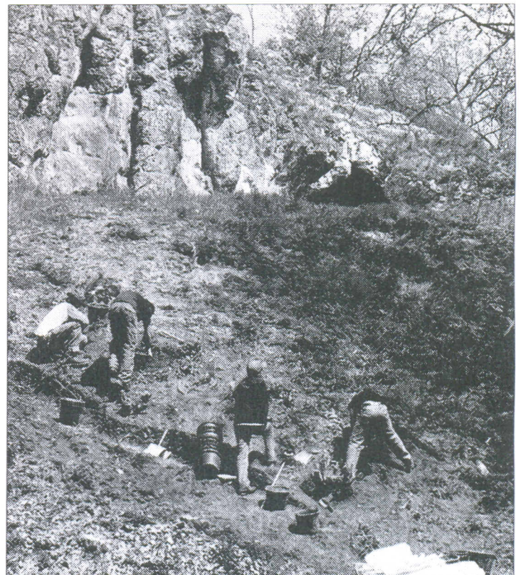
Auch dieses Jahr wird an Vogelherdhöhle wieder gegraben. Im benachbarten Archäopark sollen einmal temporär originale Fundstücke gezeigt werden.