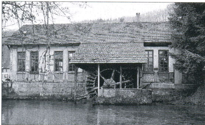
In den nächsten Wochen wird in Königsbronn der Startschuss für die Restaurierung der alten Feilenschleiferei fallen. Möglichst bis September soll sich das seit vielen Jahren stillstehende Wasserrad wieder drehen und Wasserkraft nutzbar machen, so ein erstes Ziel des Kulturvereins.

KÖNIGSBRONN. Stolz können die Mitglieder des Kulturvereins auf das sein, was sie in den letzten Jahren geschaffen haben. Nächstes Projekt ist die alte Feilenschleiferei. Bis zum Tag des offenen Denkmals im September soll sich das urige Wasserrad wieder drehen.