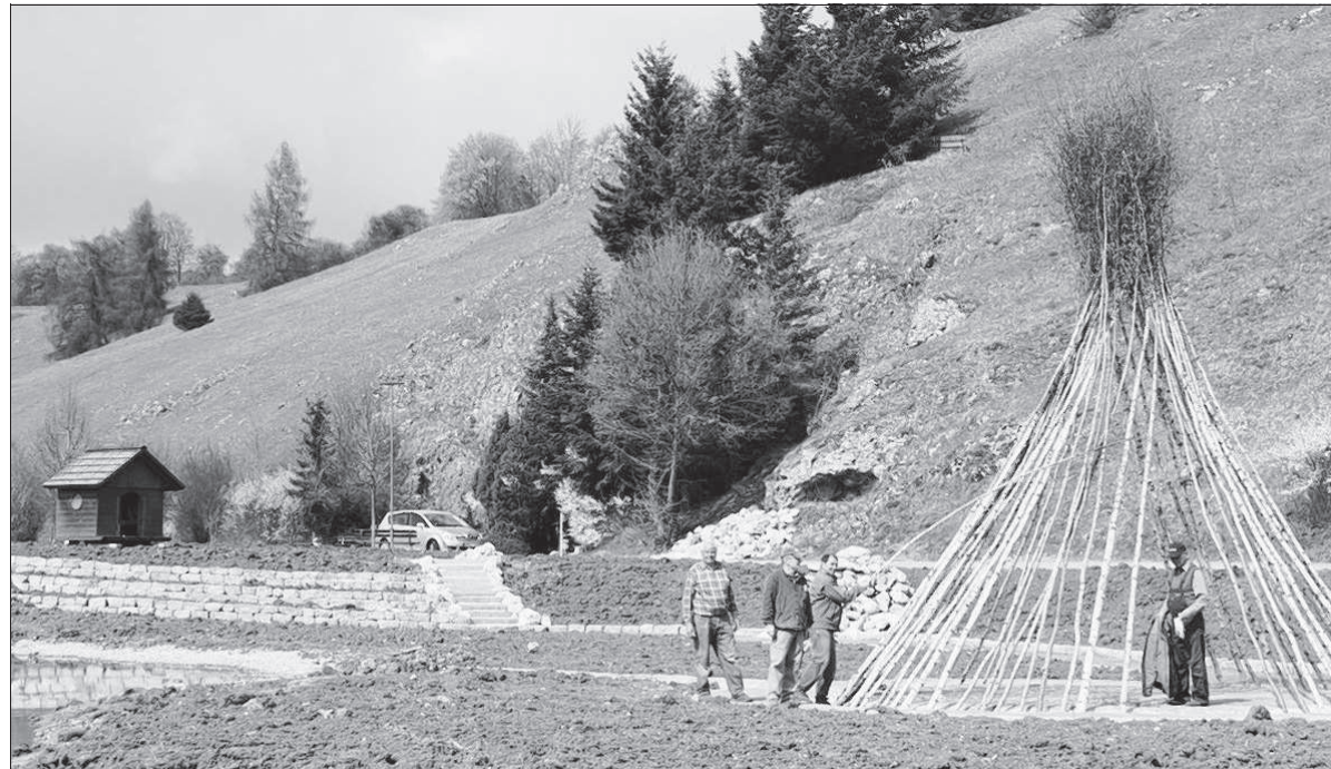
Die Freizeitanlage am Fuße des Stettbergs hat in den vergangenen vier Wochen schon deutlich Gestalt angenommen. Auf die ehrenamtlichen Helfer von SAV und Dorfgemeinschaft wartet in den kommenden zweieinhalb Monaten bis zur Fertigstellung jedoch noch viel Arbeit.

In den kommenden Wochen muss nun das Areal unter anderem eingesät werden. Ende Juni sollen die Arbeiten abgeschlossen sein. Die künftigen Besucher dürfen sich heute schon auf eine Attraktion am künstlich angelegten Hübe-Flachwasser mit der angrenzenden Spielwiese für Gesundheitsbewusste und Kneippieler freuen. Zur Ausstattung der Anlage gehören dann zudem ein Naturstein-Kräuterkegel, ein Spielbrunnen, eine Wasser-Rutsche sowie Blumenwiesen. Weiter werden heimische Sträucher und Bäume gepflanzt.