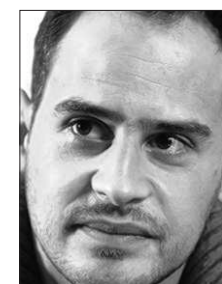
Moritz Bleibtreu hat sich für einen Sprechpreis beworben.

Beim 18. Internationalen Trickfilm-Festival vom 3. bis 8. Mai gehen in den Stuttgarter Innenstadtkinos und beim