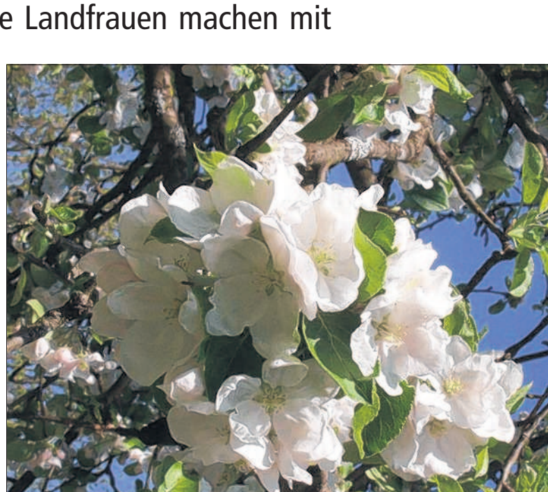
Am 15. Mai besteht die Möglichkeit, auf dem Donautal-Panoramaweg von Elchingen bis Haunsheim von einem Apfelblütenfest zum nächsten zu wandern.

Insgesamt hat der Panoramaweg im Donautal eine Streckenlänge von rund 50 Kilometern, teilte die Regionalentwicklung von Donautal-Aktiv mit. Die Regionalentwicklung ist derzeit dabei, nicht die kürzesten sondern die schönsten Wegabschnitte ausfindig zu machen. Auf der gesamten Strecke kehrt ein kostenloser „Apfelblütenexpress“, der die Wanderer zum gewünschten Ausgangspunkt bringt und auch wieder abholt.