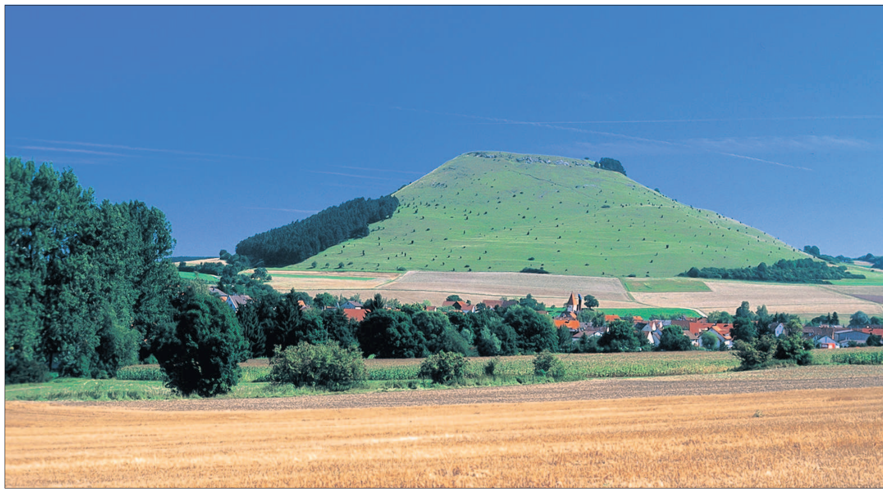
AUF DEN WEG GEBRACHT: Der Einrichtung einer Freilichtanlage am Bopfinger Ipf wurde zugestimmt. Der frühkeltische Rechteckhof Bugfeld soll anhand wissenschaftlicher Daten rekonstruiert und erlebbar gemacht werden.