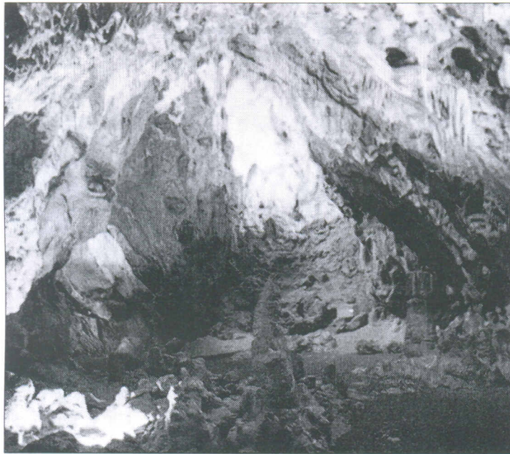
Wenn die neue Beleuchtung installiert wird, sollen die Führungen trotz der Arbeiten praktisch ohne Einschränkungen stattfinden können.

GIENGEN. Der Einbau der neuen Heizung in der Dreieinigkeitskirche ist in vollem Gange. Die Wandheizkörper sind schon an ihrem Platz. Nächste Wochen sollen die Deckenheizplatten montiert werden. Trotzdem findet wie gewohnt am Sonntag um 9 Uhr der Gottesdienst statt. Um 10 Uhr ist in der Stadtkirche ein „Gottesdienst unter der Kanzel“. Der gleichnamigen Chor wird die Messe musikalisch unterstützen.