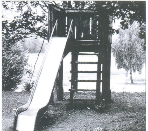
In die Jahre gekommen ist der Spielplatz oberhalb des Härtsfeldsees. Mit dem künftigen „Wassererlebnisbereich“ soll es auch hier zu Erneuerungen kommen.