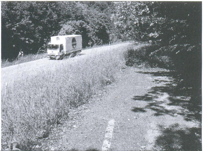
Das Beste an dem Reststück der einstigen Landesstraße zwischen Anhausen und Dettingen ist die Fahrbahnmarkierung. Diese Straße, die abrupt zu Ende ist (Bild rechts) zweigt von der „neuen“ Landesstraße ab. Doch dort steht kein Verkehrsschild, das auf eine Sackgasse hinweist, monierte ein Leser dieser Zeitung.