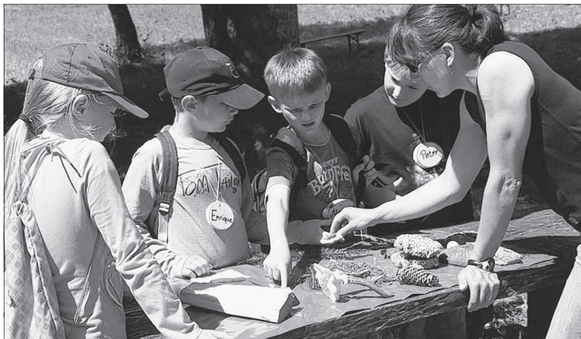
Verschiedene Gegenstände, die mehr oder minder mit dem Wald zu tun haben, mussten sich die Kinder bei den Waldjugendspielen im Öschental merken und später aufzählen.

Ansonsten aber wurden die Waldjugendspiele abermals ein großer Erfolg. Veranstalter sind die Förster und Forstwirte aus dem Kreis Heidenheim in Zusammenarbeit mit der Kreisjägersvereinigung und der Schutzgemeinschaft Deutscher Wald im Landkreis Heidenheim. Ziel der Spiele ist es, den Drittklässlern die Bedeutung des Waldes, sowie Flora und Fauna nahezubringen. Mancher Junge, manches Mädchen staunte und manche hatten noch nie zuvor das Gehörn eines Rehbocks in der Hand gehabt oder