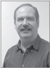
Von Klaus Dammann

Was haben wir in Sachen Archäopark Vogelherd in den letzten Monaten nicht alles erlebt. Nachdem die Überlegungen weit gediehen schienen und architektonische Gestaltungen zum Thema unterbreitet werden sollten, gab es Anfang des Jahres einen heftigen Rückschlag: Die prognostizierten Folgekosten von 126 000 Euro jährlich für den Betrieb des Präsentationsorts von eiszeitlichem Leben und Kunst waren für die kleine Stadt Niederstotzingen nicht zu bewältigen. So beschloss der Gemeinderat im Januar einen „endgültigen Projektstopp“.