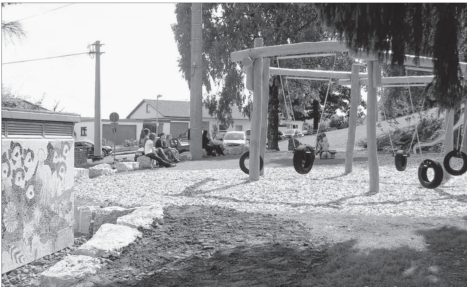
Beim Heldenfinger Kliff wurde ein Mehr-Generationen-Spielplatz angelegt. Zuschüsse dazu gab es aus dem europäischen Leader-Programm. Am 5. August wird Einweihung gefeiert.

Hier investierte sie sehr viel Herzblut, ebenso reimte sie gerne Verse und war natürlich mit dabei, wenn die „Gartenlerchen“ der Gartenfreunde auftraten. kdk