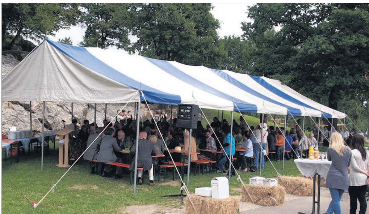
Wegen des unsicheren Wetters hatten die Organisatoren ein Zelt aufgestellt, in dem bei der Einweihung des Mehrgenerationen-Spielparks die vielen neugierigen Bürger Platz fanden.

GÜNZBURG. Die Stadt Günzburg habe im Haushaltsjahr 2010 entgegen der ursprünglichen Planung auf die Kreditaufnahme von einer halben Million Euro verzichtet können, so die „Günzburger Zeitung“. Auch eine Rücklagenentnahme von 560 000 Euro sei nicht benötigt worden. Grund seien Mehreinnahmen von 925 000 Euro bei der Gewerbesteuer und 827 000 Euro beim Einkommensteueranteil. dam