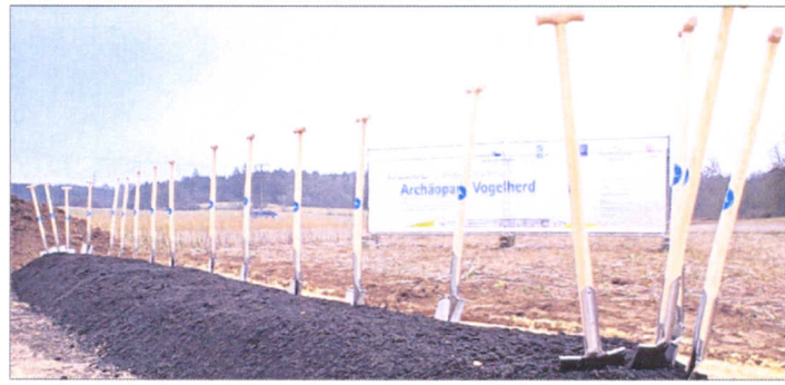
Rekordverdächtig: die Vielzahl der Arbeitsgeräte beim Spatenstich für den Archäopark.

Aus wenig, nämlich einer originalen Idee, viel machen will auch die evangelische Kirchengemeinde in Giengen: Eine Art Hitparade zugunsten der Orgelrenovierung in der Giengerer Dreieinigkeitskirche ist vorgesehen. Pfiffig und nicht alltäglich, was die Initiatoren da vorhaben, um das gute Stück wieder auf klingvollen modernen Stand zu bringen. Eine Auswahl von Liedern, auf deren einzelne Titel man Geld spenden kann, wobei die meistgewünschten und am höchsten dotierten dann gemeinsam in der Kirche gesungen werden. Eine ganz neue Form des Gesangs also, und das in der Stadt, wo ja das offene Liedersingen an Pfingsten nicht nur zum guten Ton, sondern ganz und gar zur Stadtgeschichte gehört. Und wenn deswegen danach die Kirchenorgel der St. Stadtkirche wieder in saubersten Tönen gespielt werden kann: umso besser.