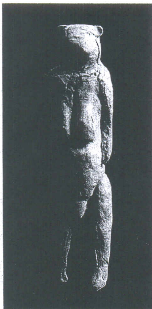
Modell des „Löwenmenschen“* Ikone der Frauenbewegung

Und auch im Bereich der Genitalien sieht der Trümmerbestand gut aus, wie einer der Ausgräber versichert: „Das Geschlecht kriegen wir raus.“