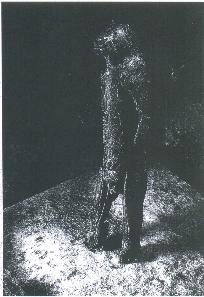
Medizinmann der Schwarzfuß-Indianer (Gemälde von 1832), Steinzeit-Statuette „Löwenmensch“: Durch den Tanz der Tierseele bemächtigen