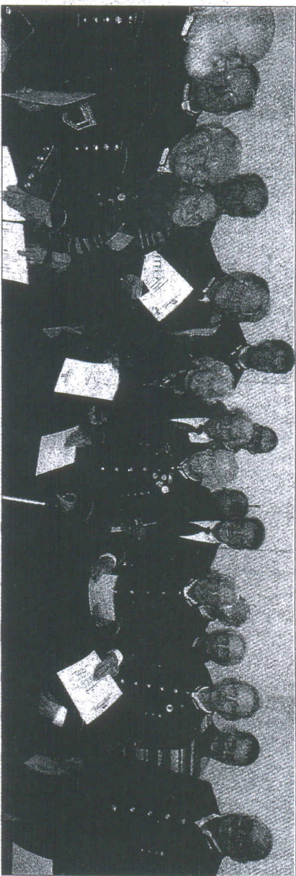
Die Mitglieder des Vereins Besucherbergwerk, die am 19. Juli 1986 spontan ihre Mitgliedschaft erklärt hatten, wurden mit einer Urkunde geehrt.

Aalen-Wasseraffingen. In einem umfassenden Rückblick ging der OB als Vorsitzender des Vereins auf die einzelnen Meilensteine in den zurückliegenden 25 Jahren ein. Dazu gehörte auch der siebte Deutsche Bergmannstag im Jahre 1991, bei 3000 Bergleute aus dem In- und Ausland vereinte. Ganz besonders herauszuheben seien die Tausende von den Vereinsmitgliedern geleisteten Arbeitsstunden, einschließlich bei der Inbetriebnahme der Grubenbahn. Stolz rühmte der Vorsitzende, dass das Besucherbergwerk mit rund 1,4 Millionen Besuchern nach wie vor die führende Stellung unter den touristischen Einrichtungen in der Region einnehme.